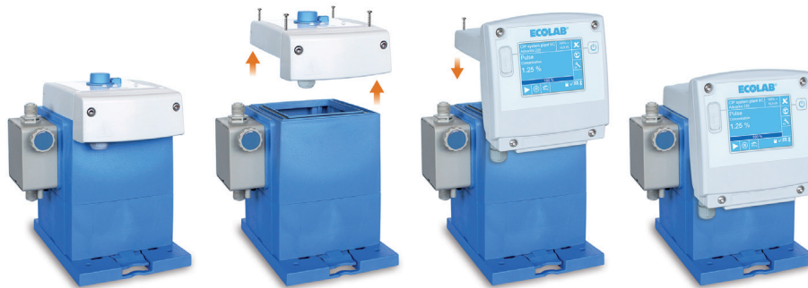
Erweiterung der Dosierpumpe von EcoEvo auf EcoAdd